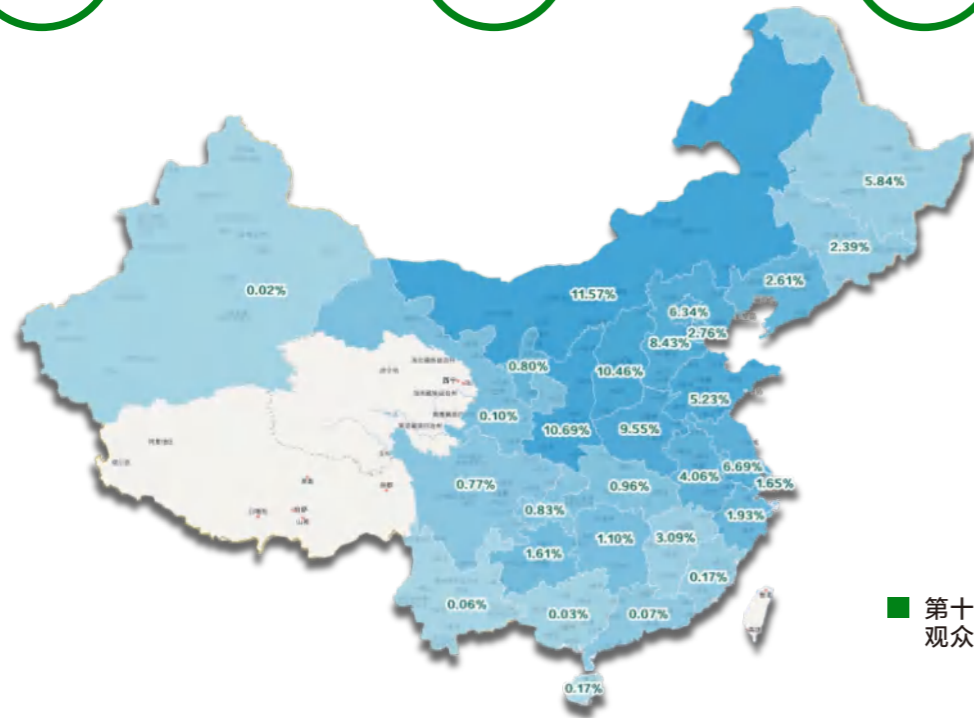
第十六届鄂尔多斯煤博会 观众来源地区分析